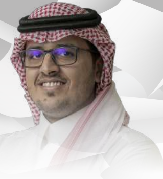
بقلم خالد الدوسري

رئيس الخدمات المشتركة في شركة ايجكس للخدمات اللوجستية