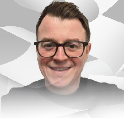
بقلم: كريغ هندي مدير الهندسة لدى Efficio